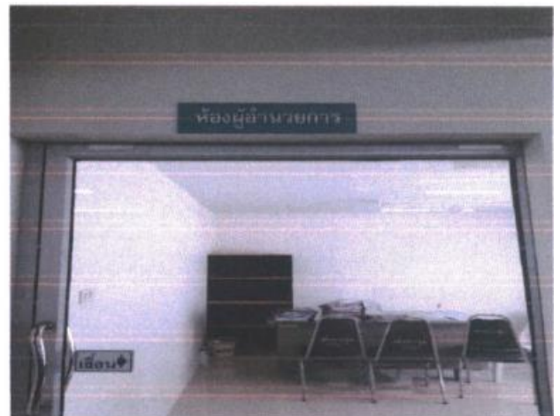
รูปที่ ๑ แสดงสถานที่กลุ่มงานบริหารทั่วไปและห้องผู้อำนวยการรับแสดงความคิดเห็น / ร้องเรียน

๒. กล่องแสดงความคิดเห็น ที่ติดตามจุดให้บริการต่างๆ