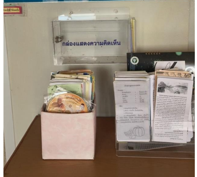
รูปที่ ๒ กล่องแสดงความคิดเห็น / ร้องเรียน ที่ติดตามจุดให้บริการต่างๆ