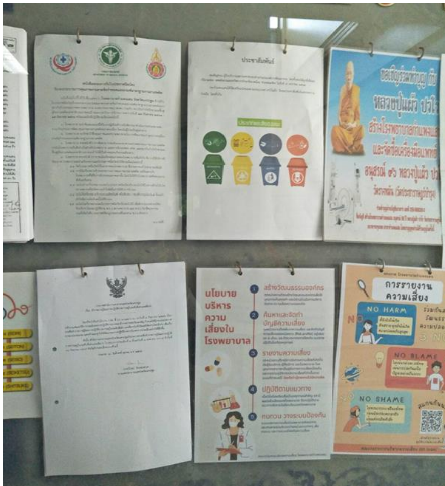
ภาพที่ ๒: ติดประกาศที่บอร์ดประชาสัมพันธ์ของโรงพยาบาลกำแพงแสน