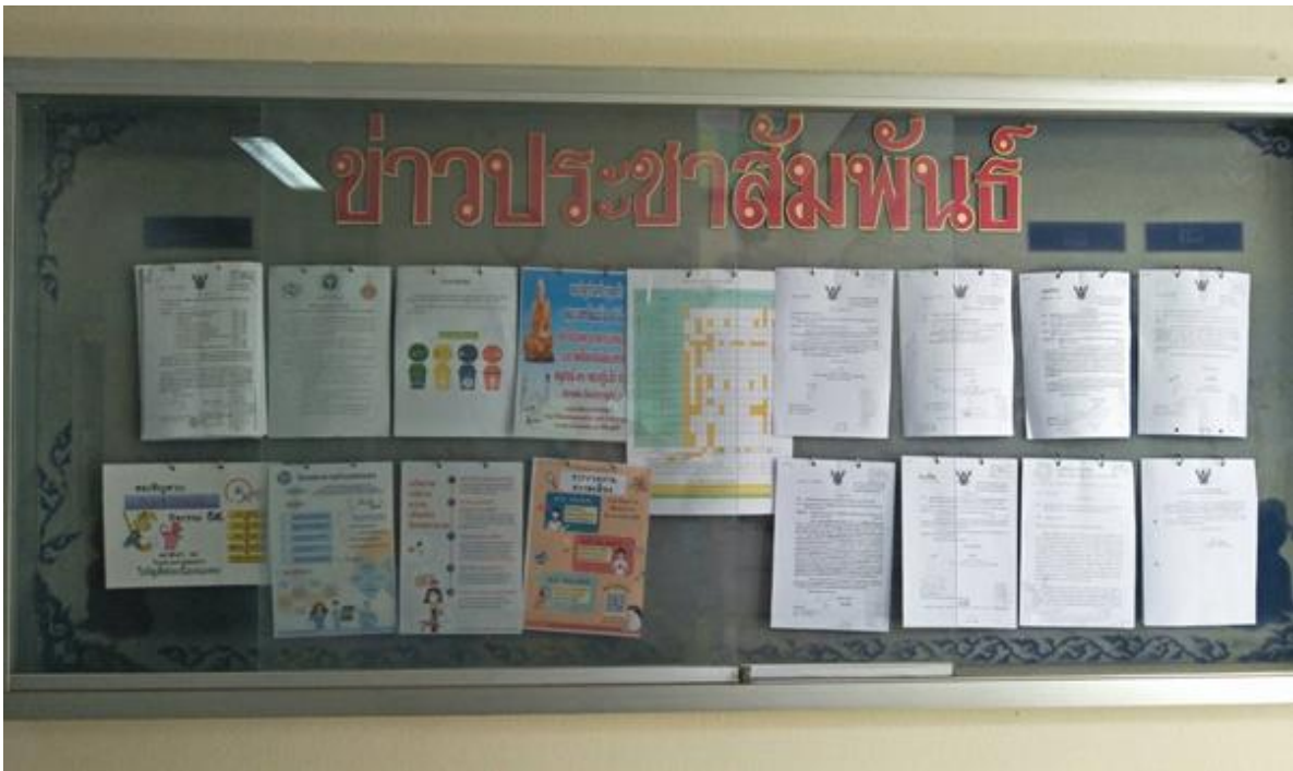
ภาพที่ ๑: ติดประกาศที่บอร์ดประชาสัมพันธ์ของโรงพยาบาลกำแพงแสน

รอบสอง ของปีงบประมาณ พ.ศ.๒๕๖๕(๑ เมษายน ๒๕๖๕ -๓๐ กันยายน ๒๕๖๕)