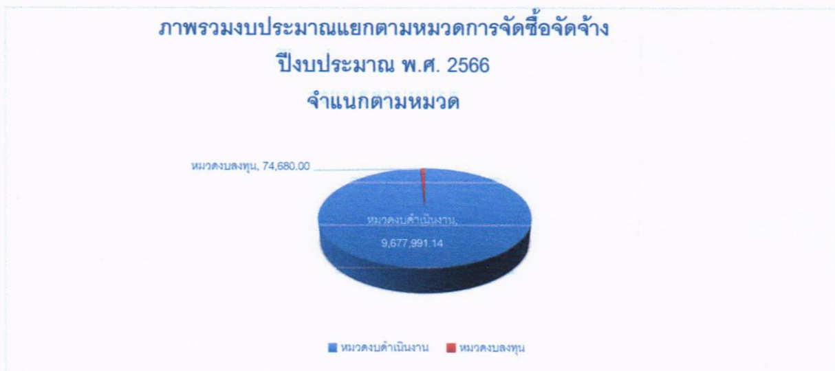
ตารางที่ 1 ผลการจัดซื้อจัดจ้างและการจัดหาพัสดุ ประจำปีงบประมาณ พ.ศ. 2566 จำแนกตามหมวด

ในไตรมาสที่ 1 หน่วยงานพัสดุ ได้ดำเนินการจัดซื้อจัดจ้าง ประจำปีงบประมาณ พ.ศ. 2566 ตามแผนการจัดซื้อจัดจ้าง โดยจำแนกเป็นรายหมวด รายการจัดซื้อจัดจ้างและการจัดหาพัสดุ แต่ละประเภท และได้เปรียบเทียบกับงบประมาณที่ตั้งไว้ และการใช้จ่ายจริงในแต่ละรายการ ดังนี้